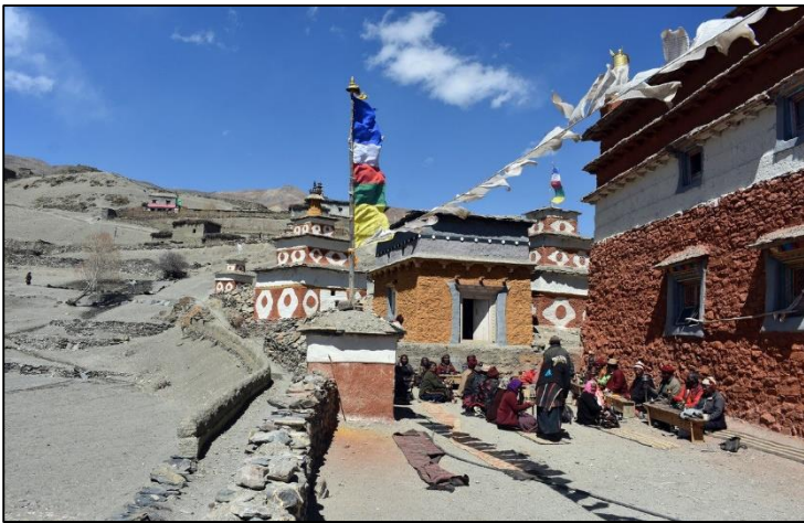
District Dolpo in NW Nepal.