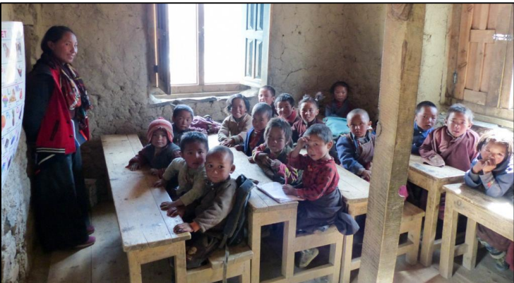
Project 2023: Mukot-kinderen in hun klaslokaal!